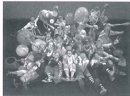
クラウンファミリープレジャーB

1994年結成。クラウンのみのパフォーマンスチーム。2015年現在メンバー約50名。