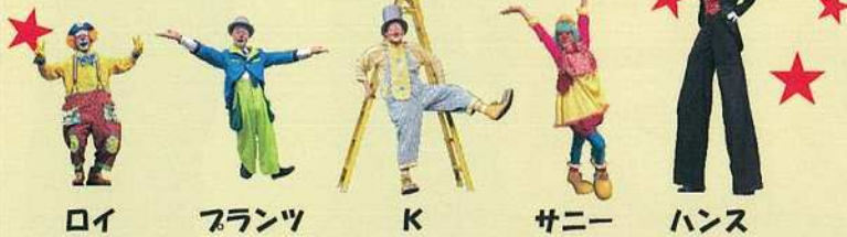
ロイ フランツ K サニー ハンス