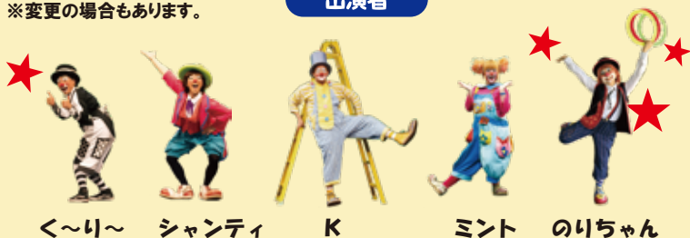
<~り~ シャンティ K ミント のりちゃん